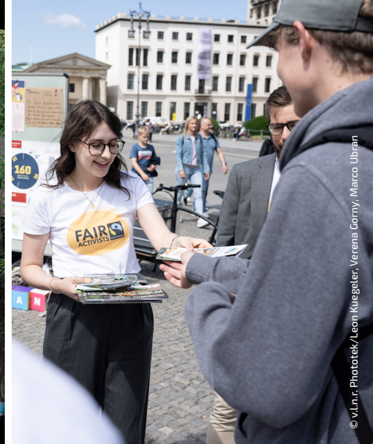
© v.l.n.r. Phototok/Leon Kuegeler, Verena Gorny, Marco Ubrani