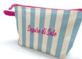
Esempi di personalizzazioni realizzate in cotone Fairtrade